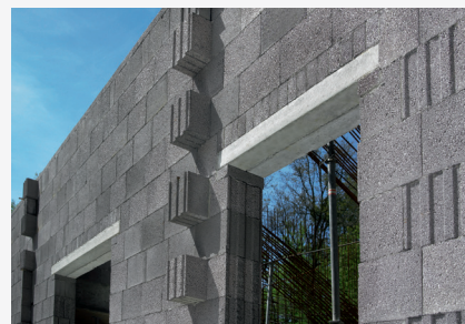
STROPY I NADPROŻA STRUNOBETONOWE