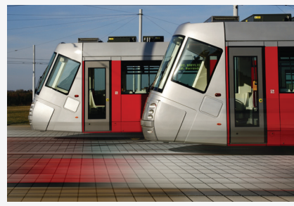
BETONOWE ELEMENTY DROGOWE

Szczegółowe informacje na temat produktów dostępne są na stronie: www.pozbruk.pl/produkty